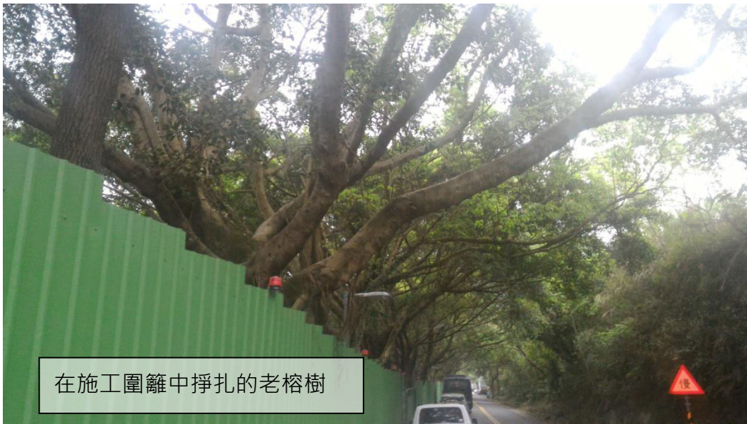
在施工圍籬中掙扎的老榕樹