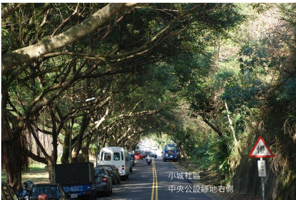
小城社區 中央公設綠地右側