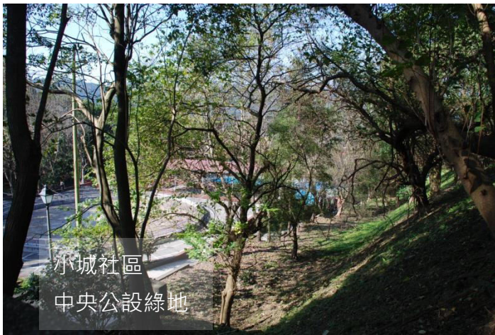
小城社區 中央公設綠地